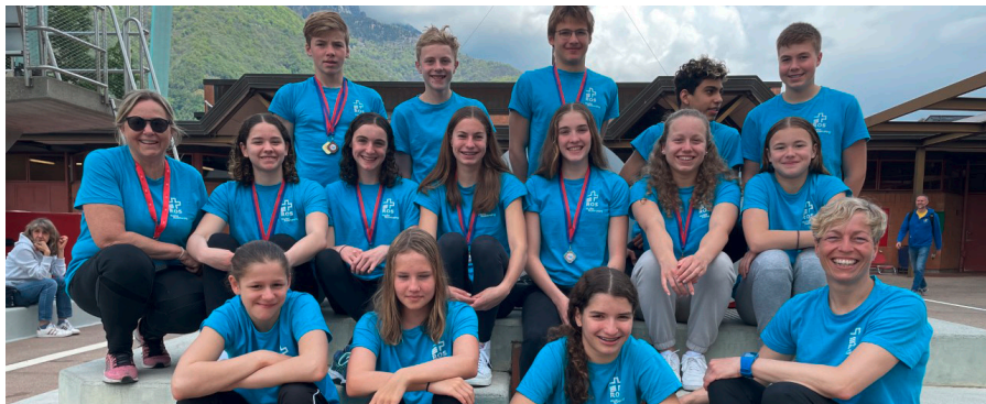
ROS-Kaderteam Jugend 2021/22 am Meeting Verbano Tenero