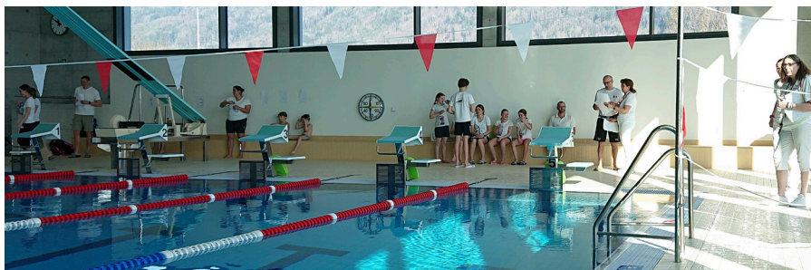
Schwimmbad Kids Liga Teil3 Süd in Balgach

Ich werde auf diese DV 2022 von meinem Amt als verantwortlicher Richter Schwimmen bereits wieder zurücktreten. Es sind mehrere Gründe, welche mich zu diesem Schritt bewegt haben. Sicher ein wichtiger Grund ist die neue Arbeitsstelle, die ich seit Oktober 2021 habe, welche mich mehr fordert als die vorangegangene. Ein weiterer ist der administrative Aufwand, den ich als regionalen Richterverantwortlicher habe, der einiges höher ist als ich es mir vorgestellt habe und für mich neben Familie und Beruf noch zu bewältigen ist. Ich werde weiter als Richter/Schiedsrichter und Kursleiter dabeibleiben.