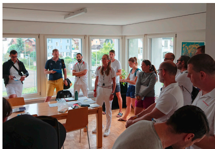
Richtersitzung Futura Teil 3 in Gossau